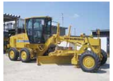
県内でもいち早く排気ガス対策型の『モーターグレーダー』

から依頼されるメインの仕事だ。最近では、土を使った新工法にも取り組んでいる。従来の工程で作ったグラウンドは、雨が降った時に水たまりが出来る。それだと子どもたちがグラウンドで走り回ることが出来なくなる。そこで考えたのが環境を意識した学校のグラウンド作りだ。透水型でも保水型の素材を地面に敷均すことにより、晴れた日には地面の水分を飽和熱として放出し、ヒートアイランド現象によつて高くなった気温を緩和してくれる機能がある。