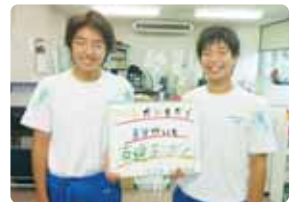
僕達が取材しました。