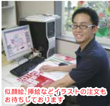
似顔絵、挿絵などイラストの注文もお待ちしております